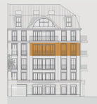
Stadthaus Vorderansicht Elvirastrasse