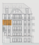
Stadthaus Vorderansicht Elvirastraße