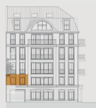
Stadthaus Vorderansicht Elvirastraße