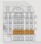
Stadthaus Vorderansicht Elvirastrasse